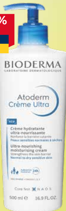
BIODERMA Atoderm Crème Ultra barojošs krēms sausiai ādai 500 ml