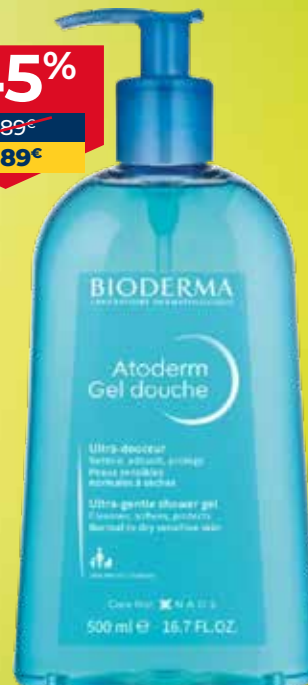
BIODERMA AtodermGel douche dušas želeja normālai un sausiai ādai 500 ml