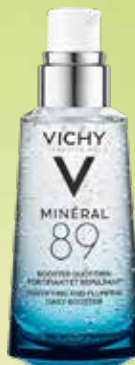
VICHY Mineral 89 mitrinošs serums sejas ādai 50 ml