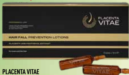
PLACENTA VITAE losjons pret matu izkrišanu N12 x 10 ml