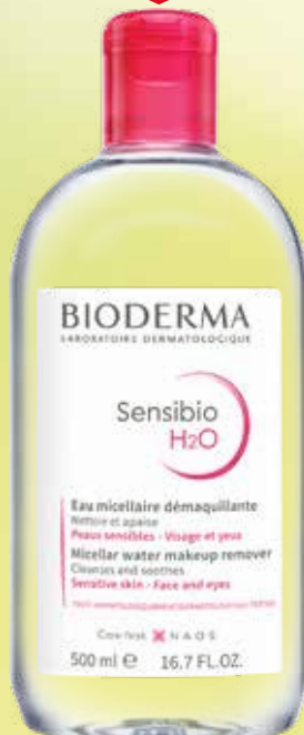
BIODERMA Sensibio H2O micerālais ūdens jutīgai ādai 500 ml