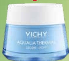
VICHY Aqualia Thermal Light mitrinošs sejas krēms normālai, jaukta tipa ādai 50 ml