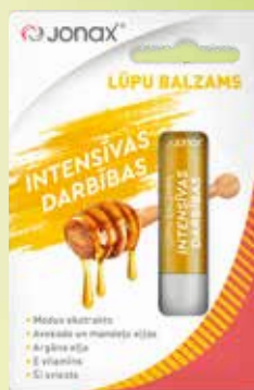
Jonax INTENSĪVAS DARBĪBAS lūpu balzams ar medus ekstraktu 4,5 g