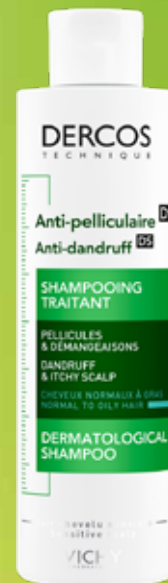
VICHY Dercos pretblaugznu šampūns normāliem un taukainiem matiem 200 ml