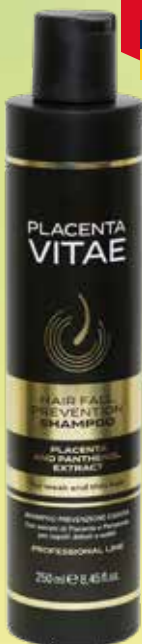
PLACENTA VITAE šampūns pret matu izkrišanu 250 ml