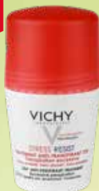
VICHY Stress Resist antiperspirants pret intensīvu svīšanu 50 ml